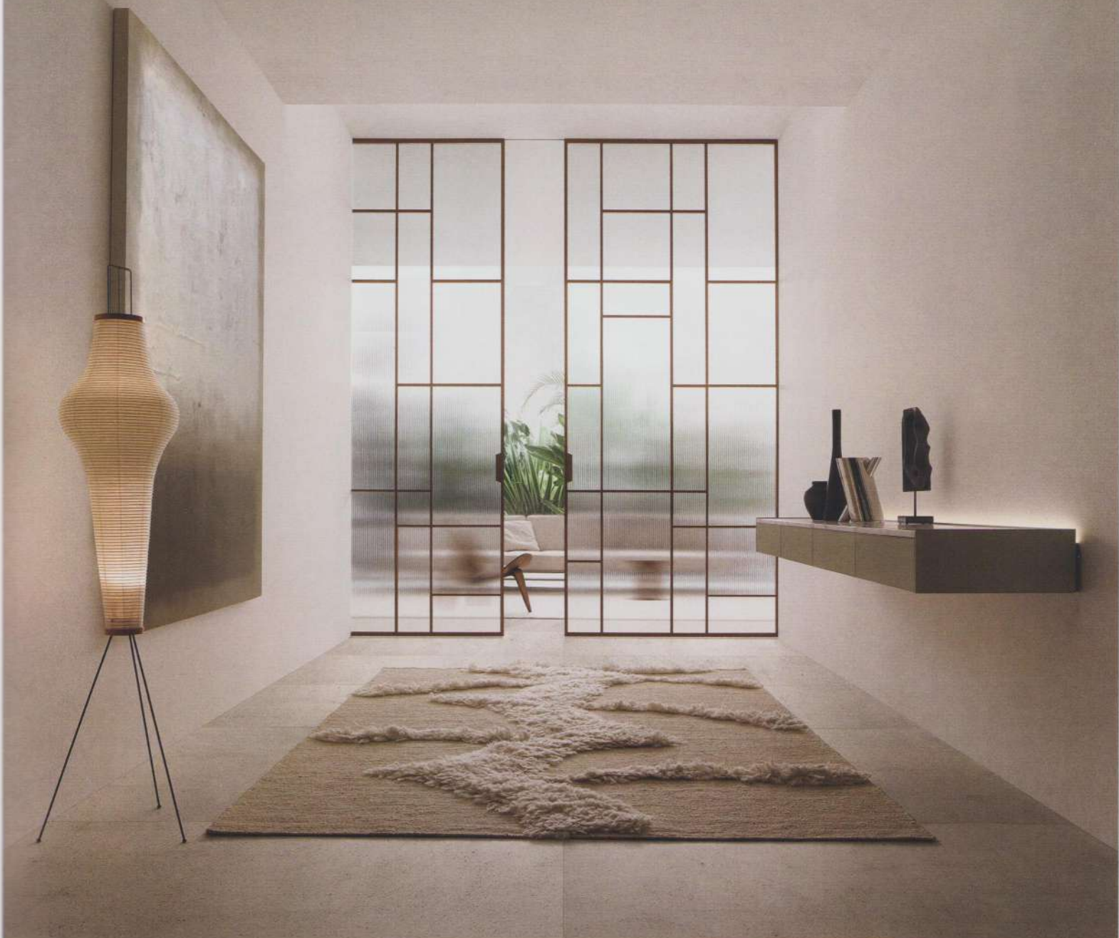
MAXI SLIDING PANELS, SELF BOLD CABINET. DESIGN GIUSEPPE BAVUSO